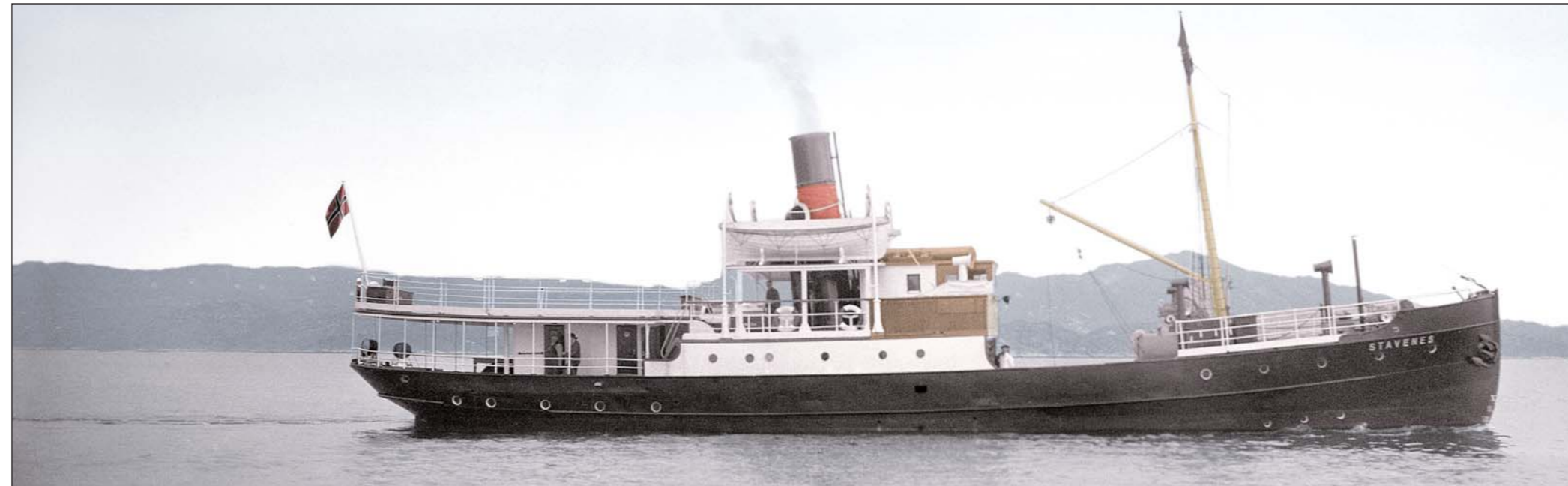
FLOTT: D/S Stavenes vart henta til Bergen i forrige veke, og vil under

(For meir informasjon: www.fjordsteam.no)