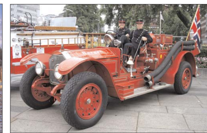
LEKKER: American La France 1920 kjem til Fjordsteam i Florø, for å delta saman med andre veterane brannbilar i paraden.