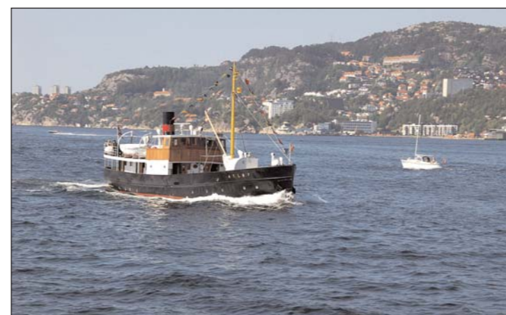
KJEM: M/S Atloy er ein av tre båtar som tek turen til Sogn.